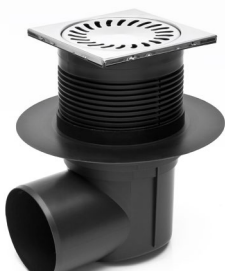
424 X N