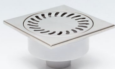
320 X N