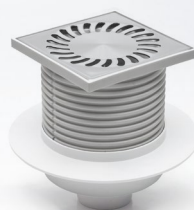
420 X L