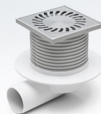
425 X L