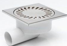
326 X N